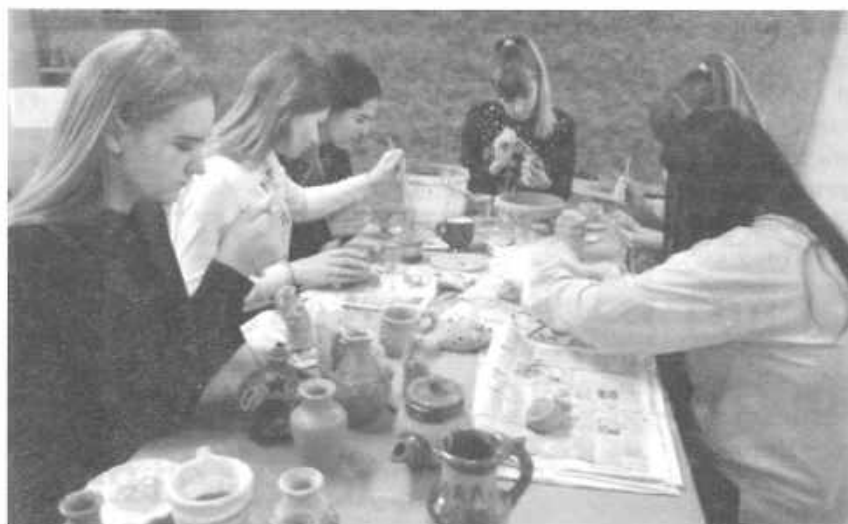
Занятия в объединении по интересам «Волшебная глина»

условия для формирования у учащихся опыта самостоятельного решения коммуникативных, познавательных, нравственных, организационных проблем. Были проведены экскурсии в краеведческий музей г. Гомеля, Аллею Героев, Музей военной славы, Музей криминалистики, выставочный зал Гомельского государственного университета имени Франциска Скорины, в Гомельский филиал Ветковского музея народного творчества, мемориальный комплекс «Криничка», мемориальный комплекс «Красный Берег».